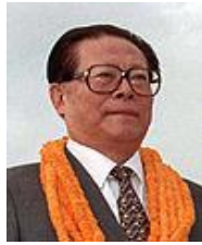
เจียง ซี มิน (Jiang Zemin)