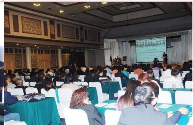
บรรยาย เรื่อง เขตการค้าเสรีอาเซียนกับการเตรียมความพร้อมของ สหกรณ์การเกษตร ครั้งที่ 5 ที่พิษณุโลก (1มี.ค.55)