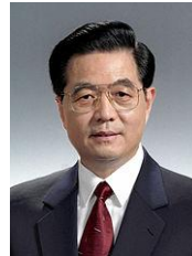
หู จิ้นเทา (Hu Jintao)