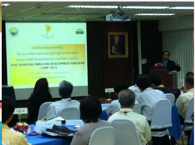
12 มี.ค. 55 พิธีเปิดหลักสูตรพัฒนาสมรรถนะผู้ช่วยผู้อำนวยการฝ่ายของการไฟฟ้าฝ่ายผลิตแห่งประเทศไทย (กฟผ.) รุ่นที่ 8 (ปี 2555) หรือEGAT ASSISTANT DIRECTOR DEVELOPMENT PROGRAM : EADP 2012 ณ การไฟฟ้าฝ่ายผลิตแห่งประเทศไทย