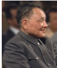
เติ้ง เสี่ยว ผิง (Deng Xiaoping)