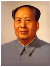
มาเซตุง (Mao Tse-tung)