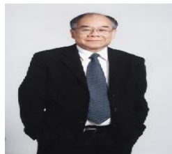
รศ.ดร.สมชาย ภคภาสน์วิวัฒน์