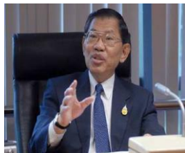
ศาสตราจารย์พิเศษ วิชา มหาคุณ