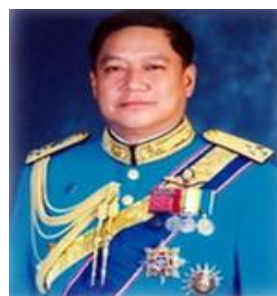
พลอากาศเอก สุกำ พล สุวรรณทัต