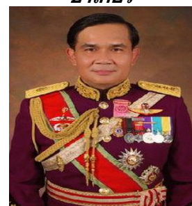
พลเอกประยุทธ์ จันทร์โอชา