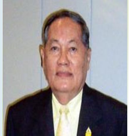
กราบขอบพระคุณ คุณฯ ดร. อ้อพล เสนาณรงค์ องคมนตรี อนุญาตให้เผยแพร่บทความพิเศษ